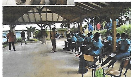
L'art du spectacle a pris possession du lycée professionnel agricole du Robert pour le bonheur des artistes, des professeurs et des élèves.

La compagnie Kaméléonite a été retenue dans le cadre de l'appel à projet « Professionnels des arts et de la culture », mené par la Direction de Affaires Culturelles et le Rectorat de Martinique. Pour le lancement de ce